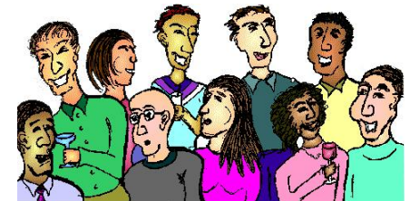
humans at a cocktail party (shared air, acoustical)