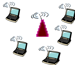
shared RF (e.g., 802.11 WiFi)